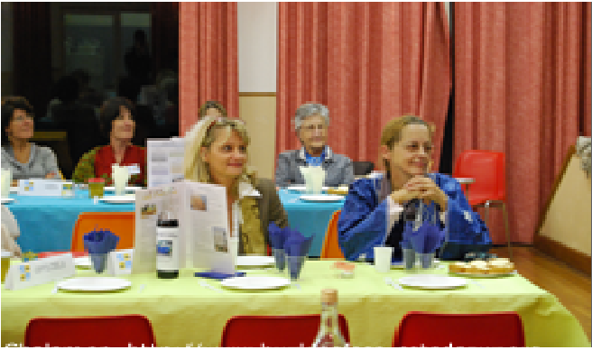
Madame l'épouse du Consul représentant le Consulat.

Parmi les convives, on pouvait noter la présence de l'épouse du Consul du Burkina Faso, la présidente de l'association Les Roses du loba et le président de l'association Kampourdoba .