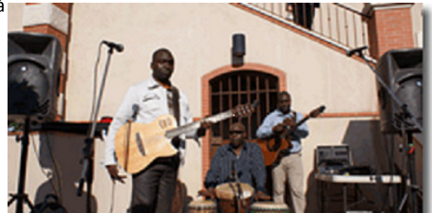
Plusieurs associations et artistes burkinabè étaient présents.

Samedi 20 novembre 2010 Soirée Contes et Musique du Burkina Faso à Cabris.